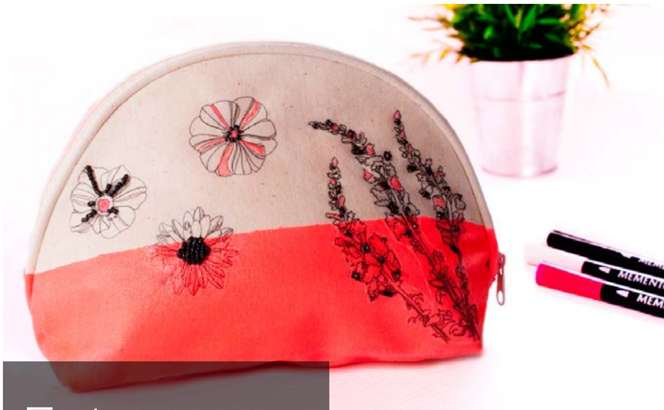
Foto transfer textil

Con la llegada de la primavera aparecen de nuevo los colores más flúor. ¡Colores vivos para el calorcito y el buen tiempo!