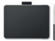
Pen tablet Wacom One S