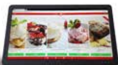
Carta de restaurante y servicios de hotel.