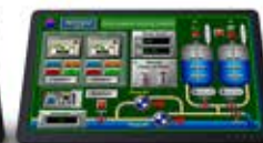
Control industrial digital