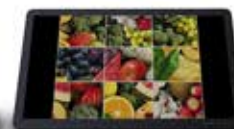
Colaboración en educación