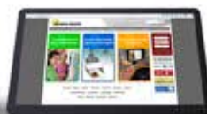
eCommerce interactivo en tienda física