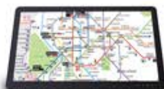
Punto de información