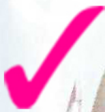
Daca de Copas

As golas são uma alternativa aos decotes e, neste caso, as golas cisne têm vindo a ganhar destaque nas tendências de vestidos de noiva pelo mundo todo.