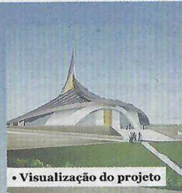
• Visualização do projeto