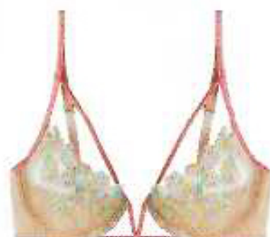
Soutien em tule com copas e aros, com bordados aplicados e pormenor de tiras à frente e tanga no mesmo tecido com dupla tira lateral, preço sob consulta, Intimissimi