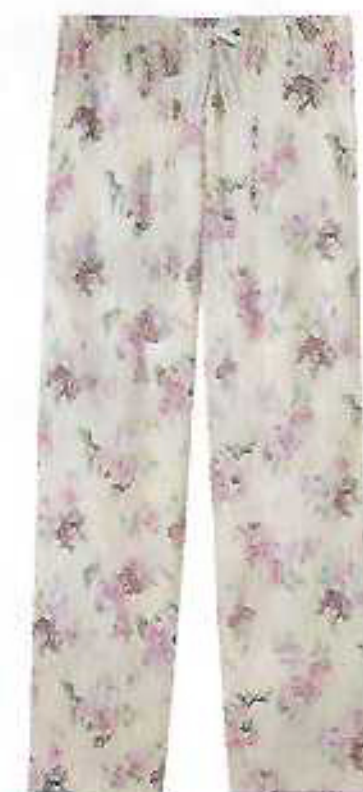
Top com aros e copas integrados, com alças de atar, preço sob consulta, e calças no mesmo tecido de algodão, €39,90, ambos Intimissimi