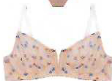
Soutien Concha de tule com relevo em desenho floral, com aro e meia copa ligeiramente almofadada, e cueca e cueca de cintura alta no mesmo tecido. €39,90 e €25,90, Cantê