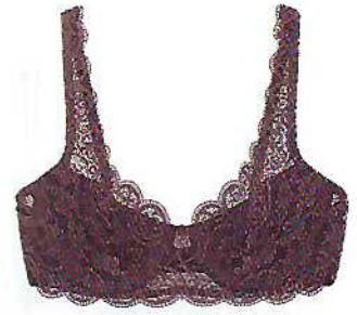
Soutien Amourette e cueca, €50 e €25, Triumph