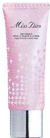
Leite exfoliante perfumado Miss Dior Rose Granita, para o corpo, infundido com água de rosa Centifolia (75 ml), €50, Dior