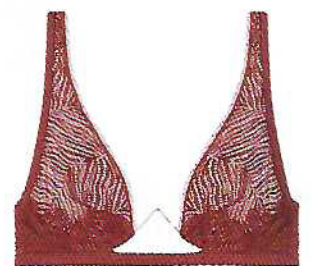
Soutien balconette e cueca brasileira Go Animalier, €35,90 e €12,90, Intimissimi