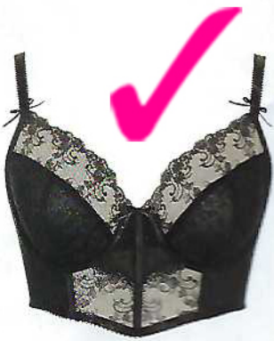
Bustier com alças e decote em forma de coração e cueca em renda Camille, €64 e €28, Dama de Copas

Mesmo à noite, em casa, nos momentos mais relaxantes, é importante que se sinta fantástica e muito confortável. É nesses momentos que recupera do dia a dia e que repõe a sua energia, mas mais do que isso. Cada minuto ou atenção que dedica a si própria vale ouro, e faz milagres pelo seu bem-estar. Uma lingerie bonita ou um quentinho e confortável pijama nunca são demais, e precisam de ser renovados com alguma frequência. Estas são as nossas sugestões para este outono-inverno.