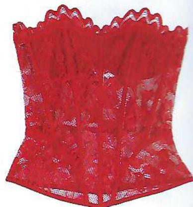
Bustier sem alças e tanga em renda, €22,99, Tezenis