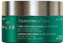
Creme de corpo Nuxuriance Ultra anti-idade, para uma hidratação profunda e ação de firmeza (200 ml), €63,65, Nuxe