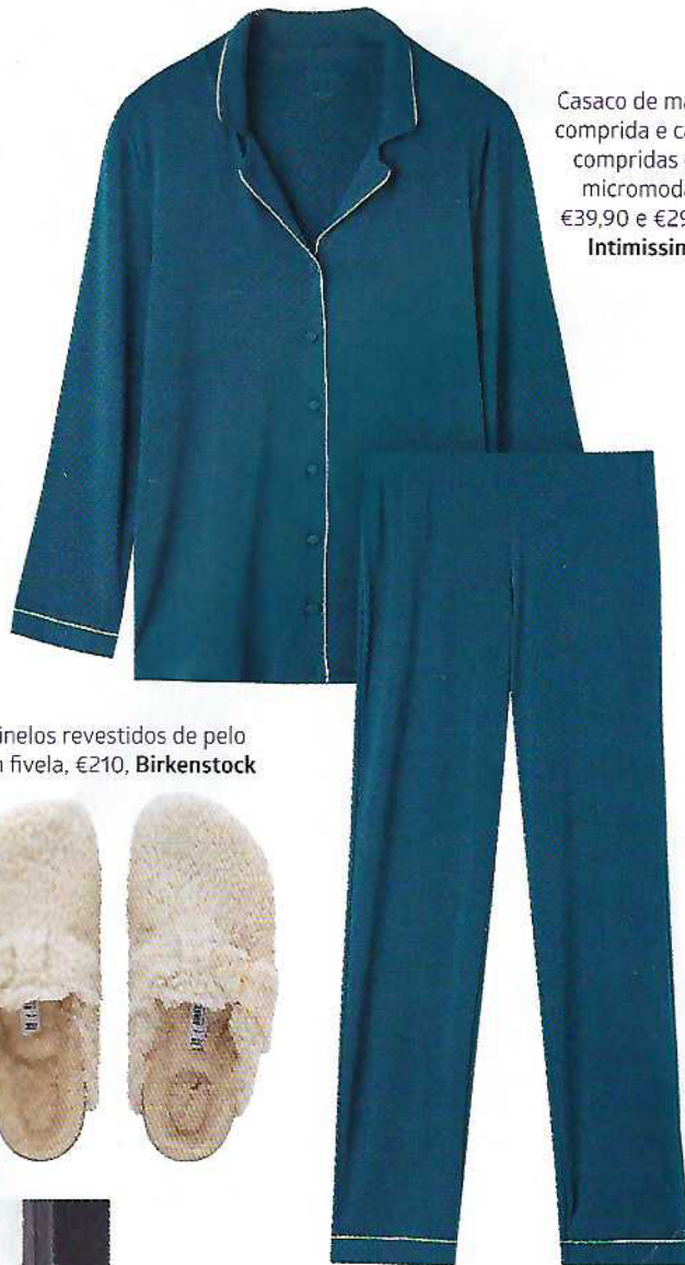
Casaco de manga comprida e calças compridas em micromodal, €39,90 e €29,90, Intimissimi