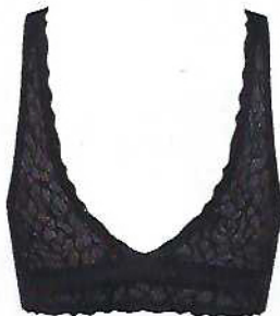
Soutien Zero Feel Lace e cueca brasileira, €45 e €18, Sloggi