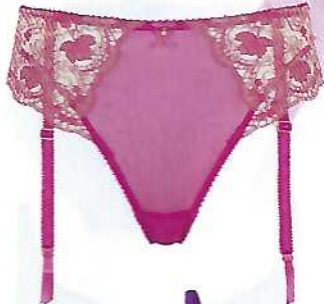
Body de renda com ligueiro Savage Fenty, preço sob consulta, Lingerie by Rihanna