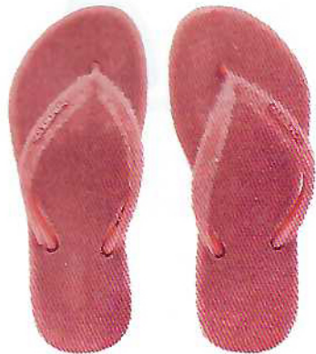
Chinelos slim plush, €42, Havaianas