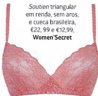
Soutien triangular em renda, sem aros, e cueca brasileira, €22,99 e €12,99, Women'Secret