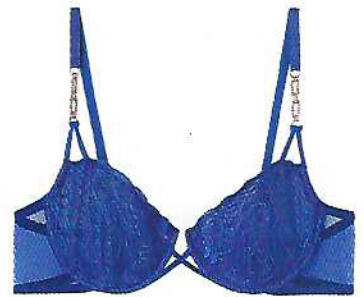
Soutien balconette e cueca brasileira Sweet Escape, €35,90 e €12,90, Intimissimi