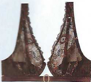
Soutien com aros em renda e tule, com pormenor metálico dourado e tanga em renda e tule, €35,90 e €12,90, Intimissimi