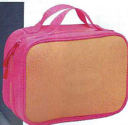
Nécessaire com dois compartimentos, €26, Havaianas