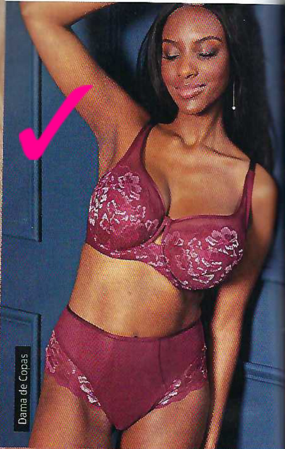
Dama de Copas