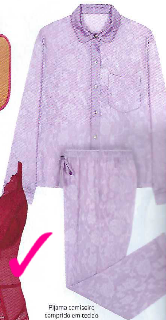
Pijama camiseiro comprido em tecido translúcido de cetim estampado, €49,99, Women'Secret