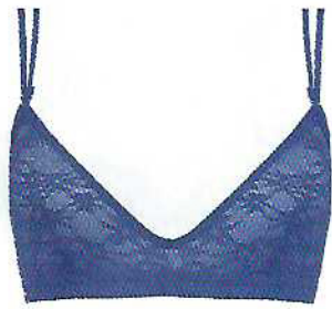
Soutien triangular em renda e cueca brasileira, €16,99 e €8,99, Hi&Bye