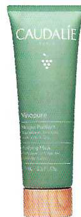
Máscara purificante Vinopure, com argila verde e zinco para melhorar o aspecto da pele e diminuir os poros (75 ml), €23,90, Caudalie