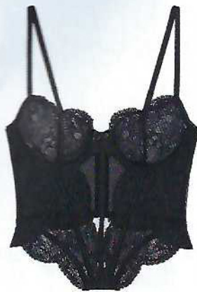
Bustier em renda e tule e cueca de renda Savage Fenty, preço sob consulta, Lingerie by Rihanna