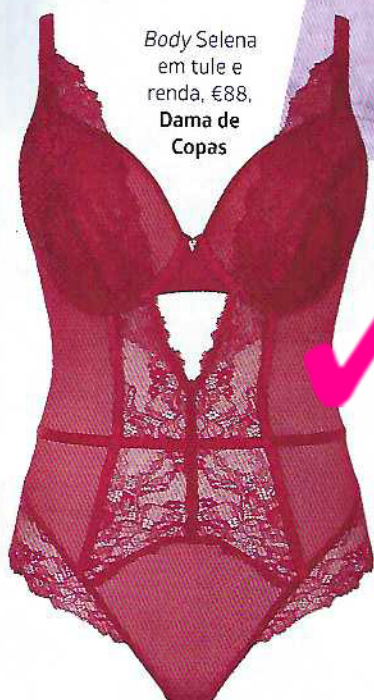
Body Selena em tule e renda, €88, Dama de Copas