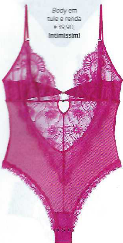
Body em tule e renda €39,90, Intimissimi