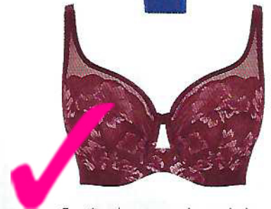
Soutien de copa mole rendado e cueca asa delta de cintura alta rendada Sabrina, €66 e €36, Dama de Copas