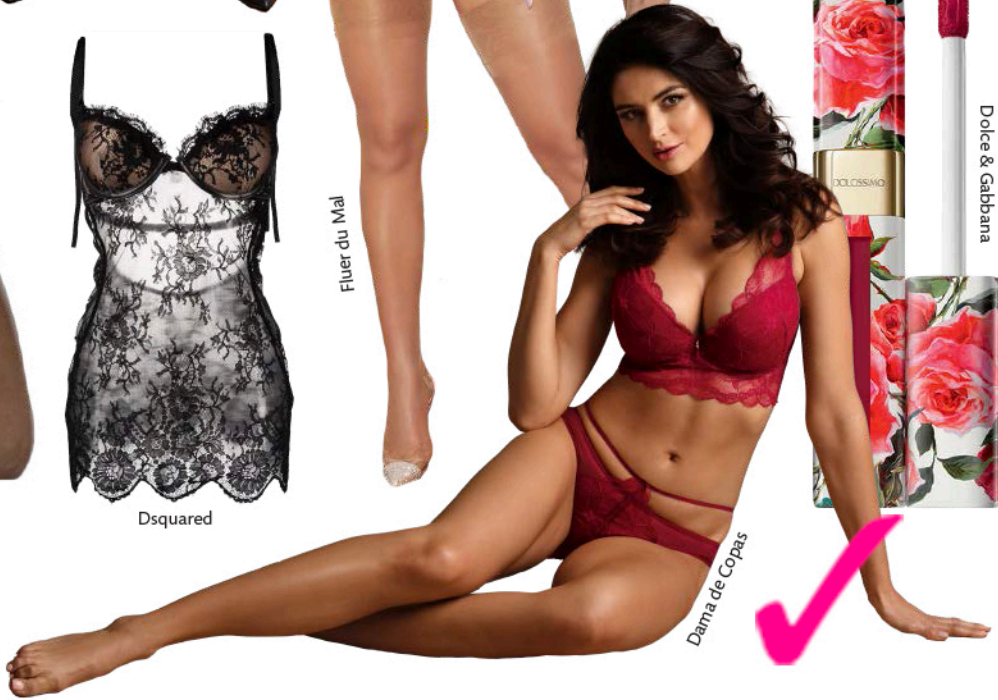
Dama de Copas