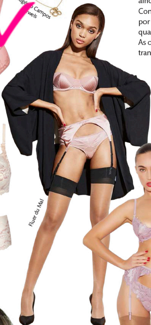
Fluer du Mal