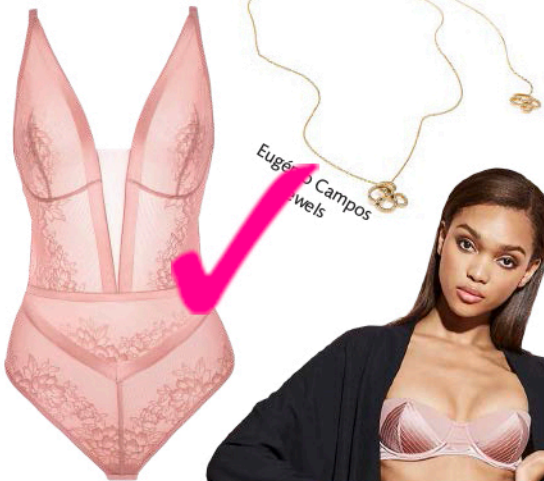
Eugénio Campos Jewels

As opções são algumas, mas a escolha é sua: rendas, transparências, sedas ou mesmo aplicações florais.