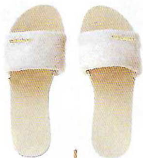
Chinelos com pelo, €45, Havaianas