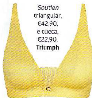
Soutien triangular, €42,90, e cueca, €22,90, Triumph