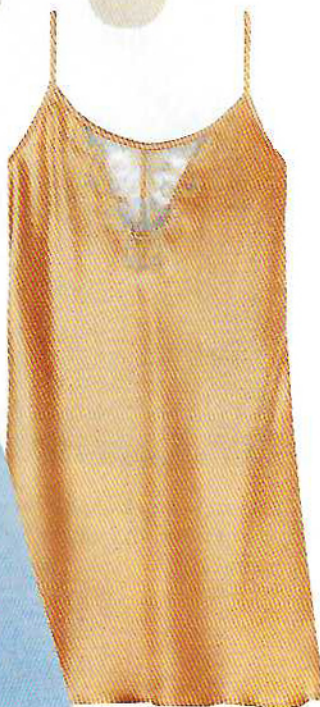
Combinação em seda Shift Into Neutrals, €69,90, Intimissimi