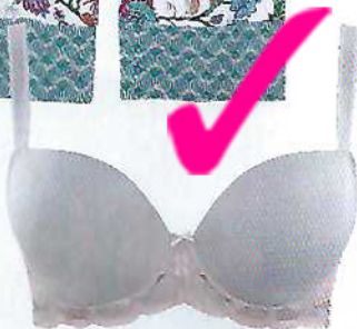
Soutien Clara moldado com decote em coração, €56, e cueca clássica rendada, €25, Dama de Copas