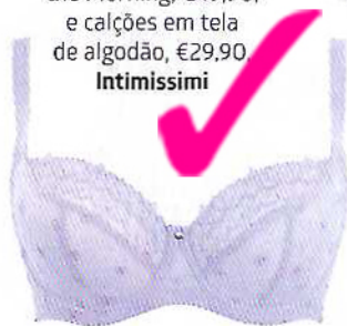
Soutien Blossom balconette de copa mole, €48, e cueca asa-delta, €22, Dama de Copas