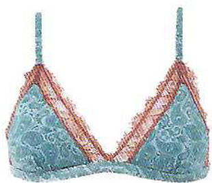
Soutien triangular Olivia, €22,90, e tanga, €12,90, Brownie