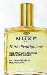
Huile Prodigieuse, o óleo seco multifunções para a pele do rosto, corpo e cabelo (100 ml), €29,90, Nuxe