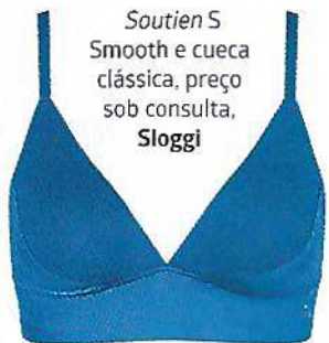
Soutien S Smooth e cueca clássica, preço sob consulta, Sloggi