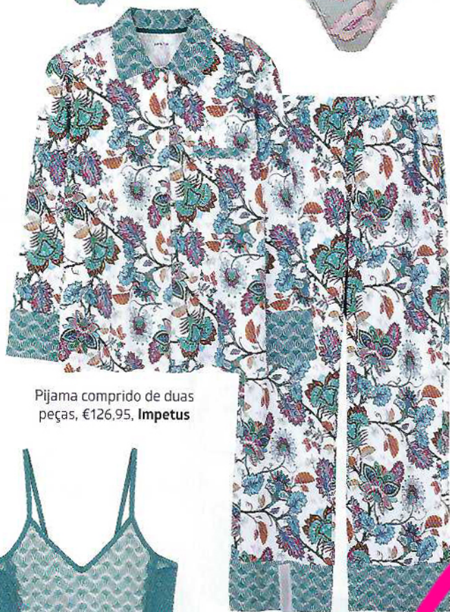
Pijama comprido de duas peças, €126,95, Impetus