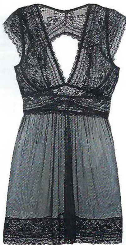
Camisa de dormir Glicínia em tule e renda, €62,90, My Intimate by Cantê