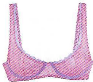
Soutien Iris em renda, €35,90, e cueca Lírio, €23,90, My Intimate by Cantê