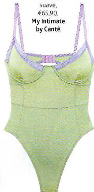
Body Hera em malha de brilho suave, €65,90, My Intimate by Cantê