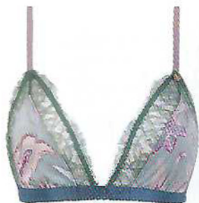
Soutien triangular, €24,99, e cueca brasileira, €12,99, Women'Secret