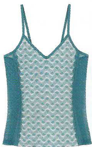
Top de alças com renda, €46,95, e cueca subida, €26,95, Impetus