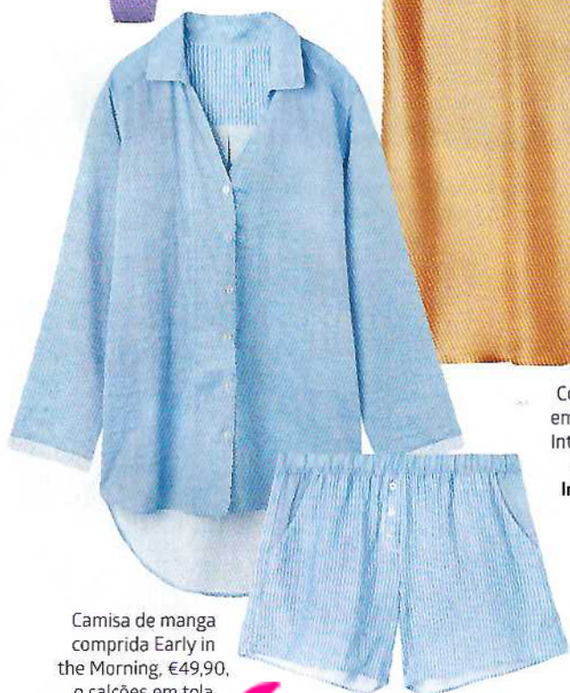
Camisa de manga comprida Early in the Morning, €49,90, e calções em tela de algodão, €29,90 Intimissimi