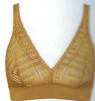
Soutien S Seven bralette e tanga, preço sob consulta, Sloggi