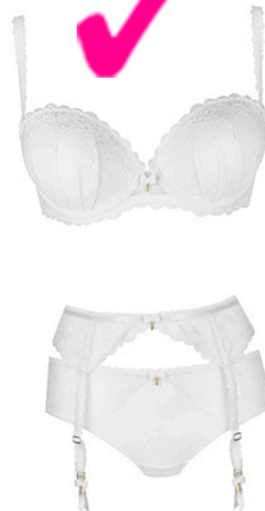
Dama de Copas