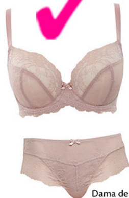
Dama de Copas