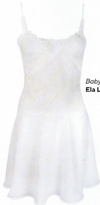
Babydoll, 249,90 €, Ela Lingerie