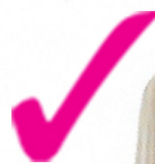
Robe, 139 €, Dama de Copas