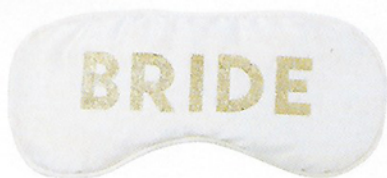
Venda, 13,49 €, Victoria's Secret

O universo da lingerie cumpre todas as promessas que faz. Confira as nossas sugestões.