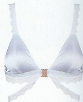
Sutiã, 47 €, Lola Wants Cuecas, 19,50 €, Lola Wants