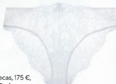
Cuecas, 175 €, La Perla