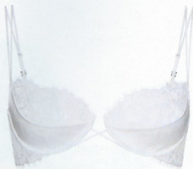
Sutiã, 310 €, La Perla