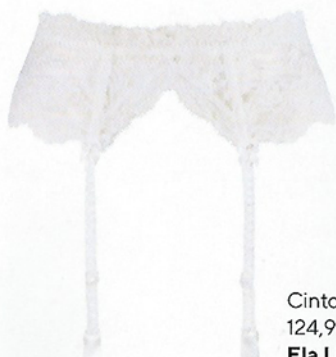
Cinto de ligas, 124,90 €, Ela Lingerie