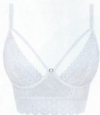
Conjunto, 39,98 €, Women'Secret