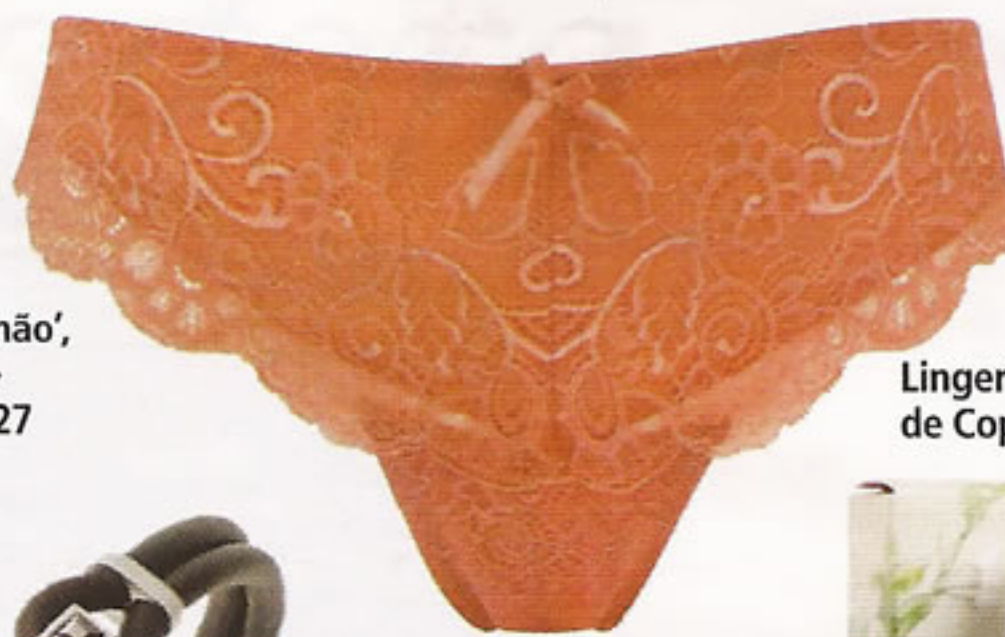
Lingerie Dama de Copas, €22