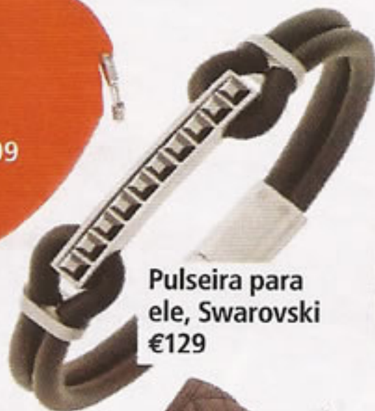
Pulseira para ele, Swarovski €129