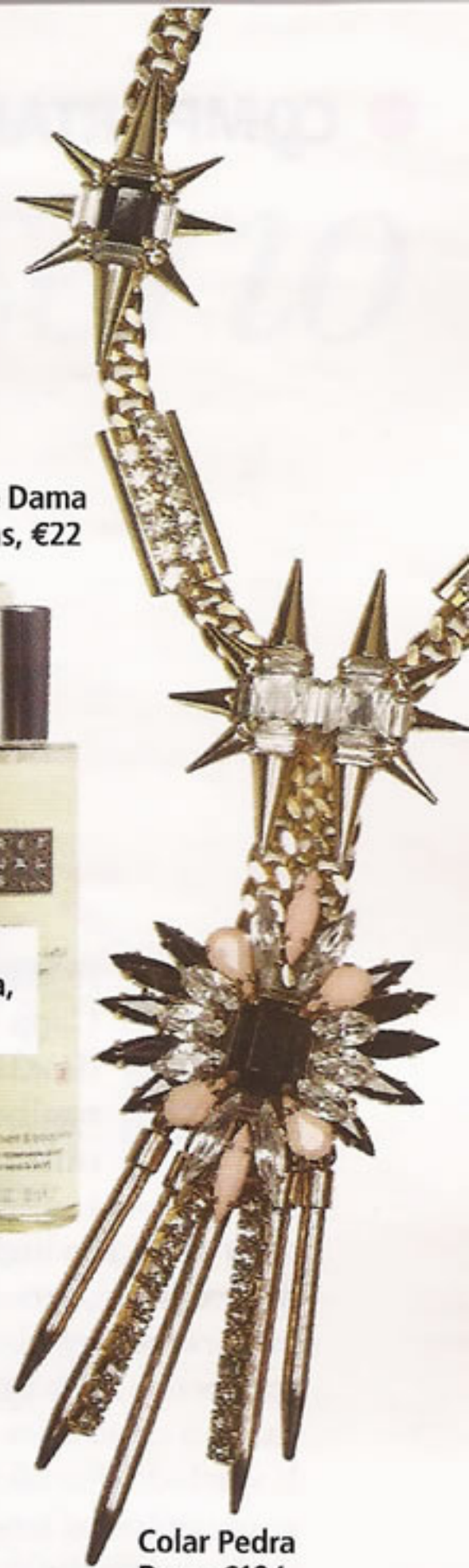
Colar Pedra Dura, €194