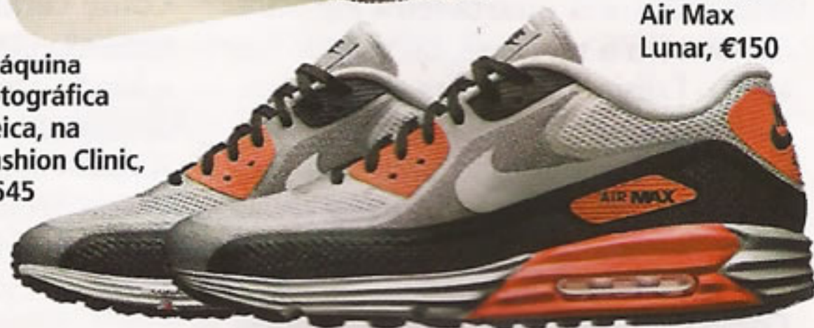
Tênis Nike Air Max Lunar, €150