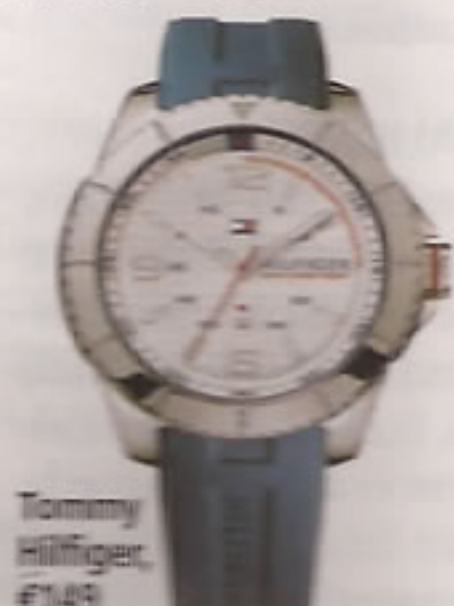
Tommy Hilfiger, €149