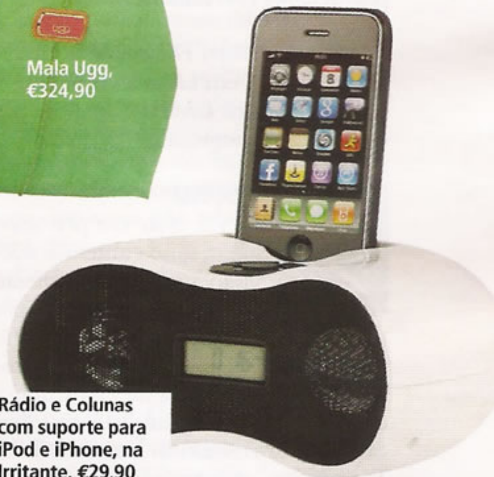
Rádio e Colunas com suporte para iPod e iPhone, na Irritante, €29,90