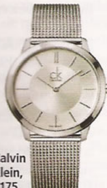
Calvin Klein, €175