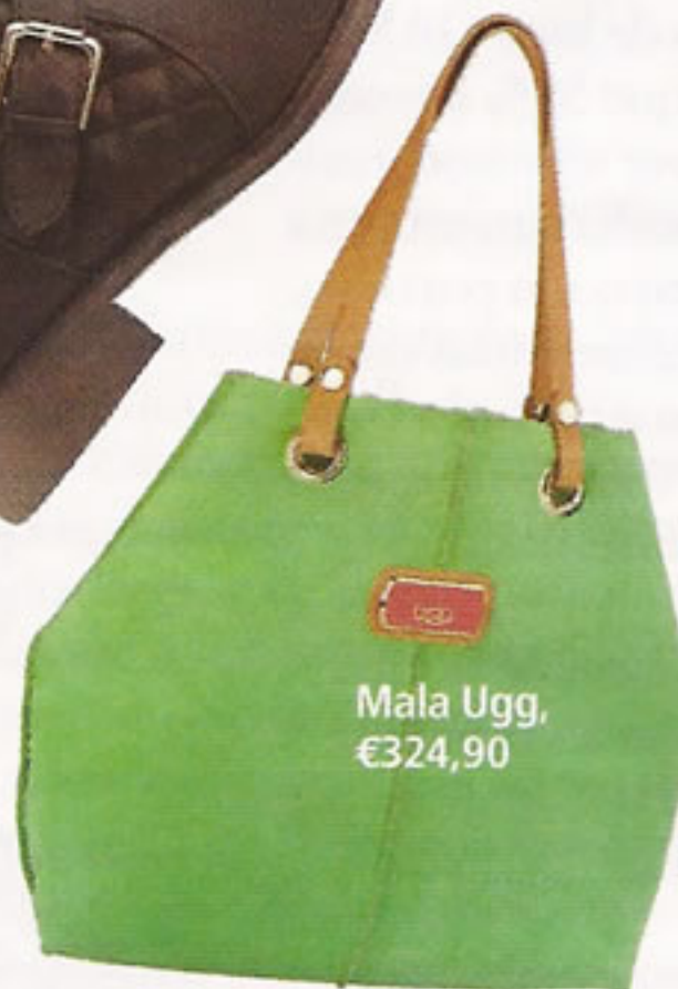
Mala Ugg, €324,90