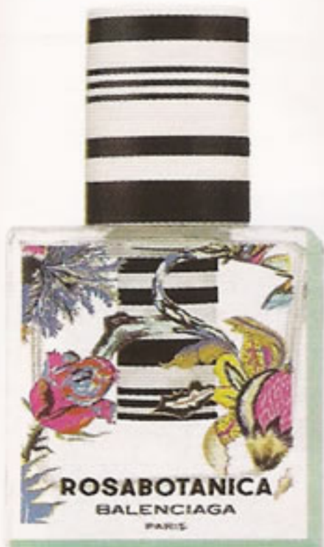
Eau de parfum Rosabotanica, Balenciaga, desde €58,78