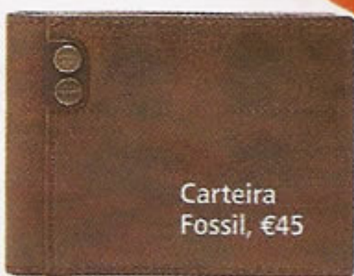
Carteira Fossil, €45