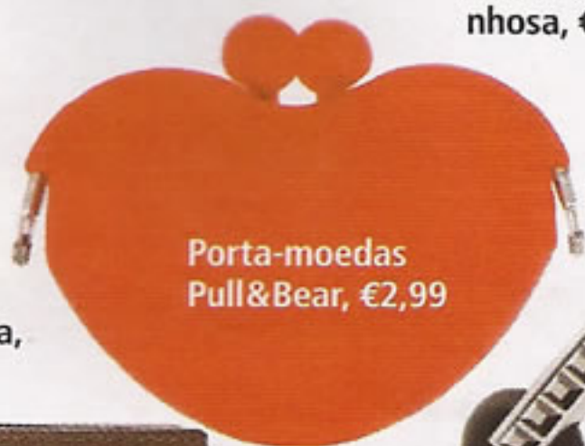
Porta-moedas Pull&Bear, €2,99