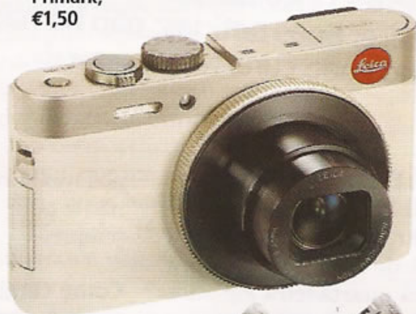
Máquina fotográfica Leica, na Fashion Clinic, €645