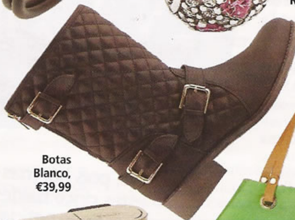
Botas Blanco, €39,99