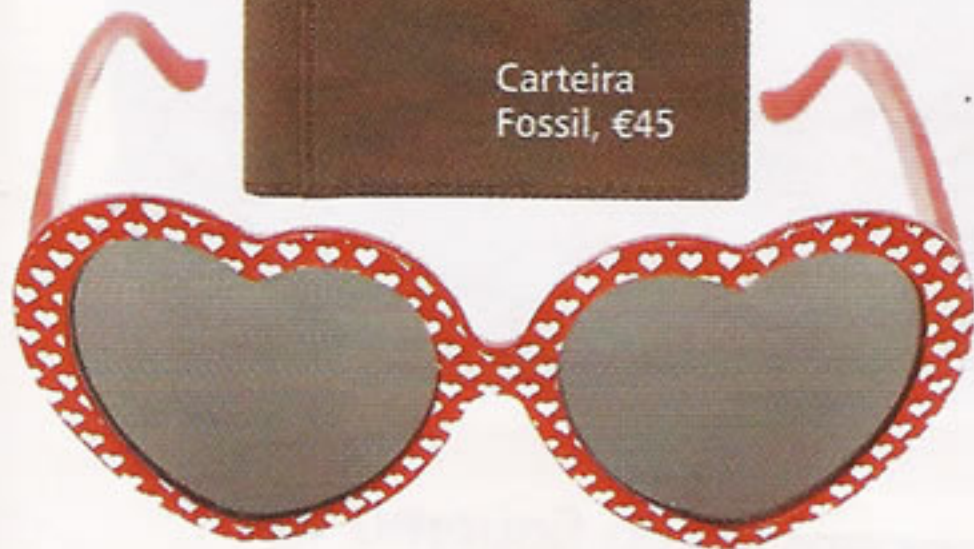
Óculos Primark, €1,50