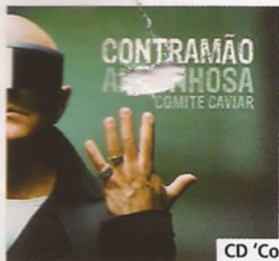
CD 'Contramão', Pedro Abru-nhosa, €15,27