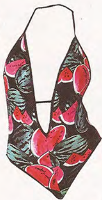
American Apparel 48€