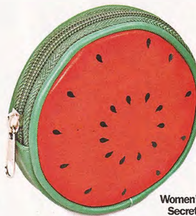
Women' Secret 3,99€