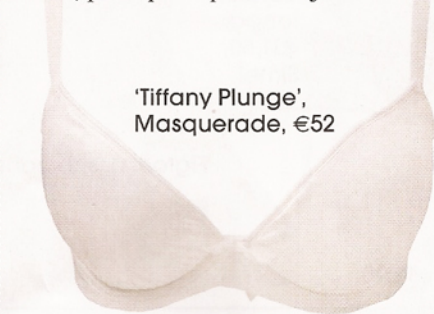
'Tiffany Plunge', Masquerade, €52