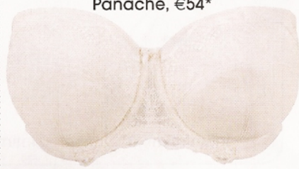
Caicai 'Evie', Panache, €54*

Este tipo de vestido pode ser usado com um sutiã caicai, em que a zona entre as copas assente numa parte mais alta do esterno, dando mais suporte ao peito. Por isso, pode ser uma boa opção para mulheres de peito médio ou volumoso.