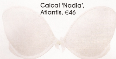
Caicai 'Nadia', Atlantis, €46

Este tipo de vestido é o grande favorito das noivas nacionais. "Uma vez que o decote em coração é mais profundo, necessitam de um sutiã caicai onde a junção das copas assente numa zona mais baixa do esterno. Por isso, o sutiã vai dar mais sustentação ao peito pequeno ou médio do que ao grande", observa Inês.