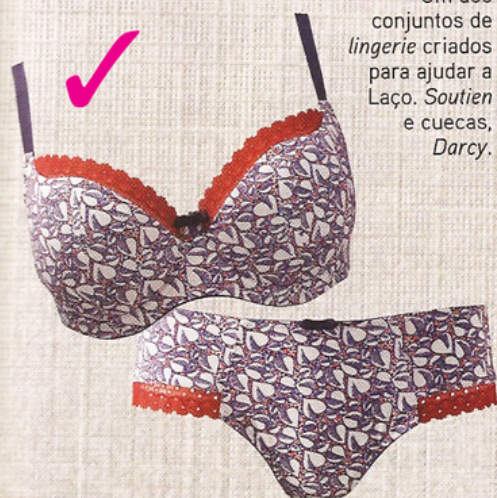
Um dos conjuntos de lingerie criados para ajudar a Laço. Soutien e cuecas, Darcy.