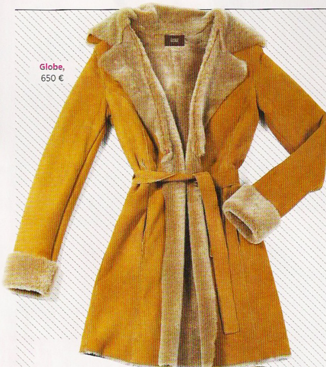
Globe, 650 €