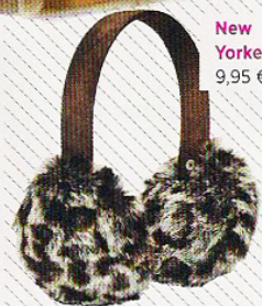
New Yorker, 9,95 €

Gostamos especialmente da conjugação com estampados animais, para um autêntico look nórdico. E a boa notícia é que hoje em dia é possível fazê-lo recorrendo apenas a tecidos sintéticos.