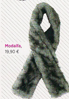
Modalfa, 19,90 €