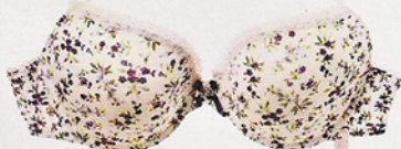
De elastano e tule Gisela, €22,13 (o conjunto)

Aceitámos o convite da Dama de Copas para fazer uma sessão de Bra Fitting *. E ficámos a perceber quais os pontos mais importantes na escolha de um soutien . Por Sílvia Sousa