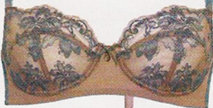
De renda e elastano Intimissimi, €25,90