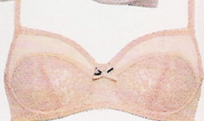
De renda e elastano da linha Shape, da Intimissimi, €25,90