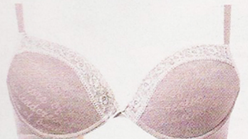
De algodão e elastano Under Colors of Benetton, €10,90