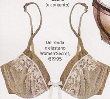
De renda e elastano Women'Secret, €19,95