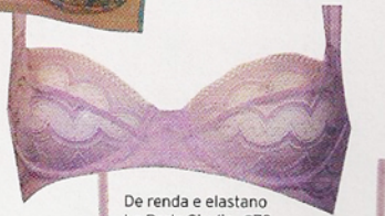
De renda e elastano La Perla Studio, €78