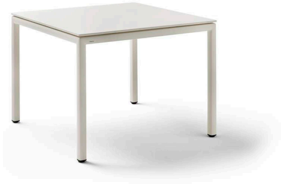
TABLE À MANGER CARRÉE RÉF.: 77910