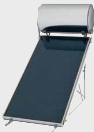
SIME NATURAL 160 S superficie plana (2,09 m 2 )