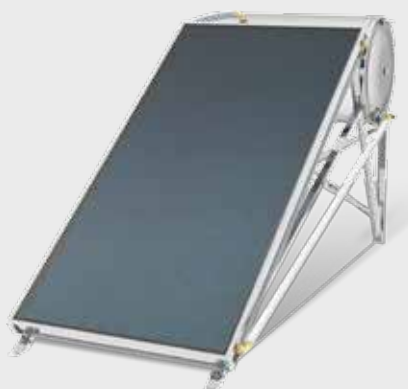
SIME NATURAL 200 S LP superficie plana (2,6 m 2 )