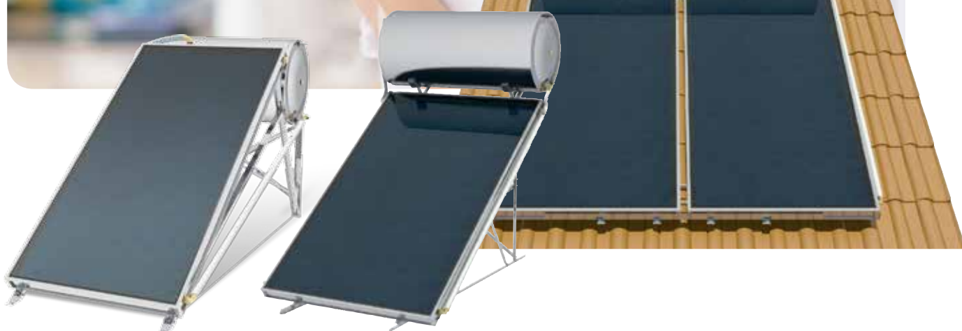
Sime Natural S LP