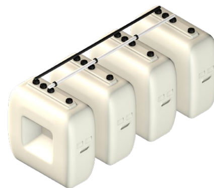
Rothalen 500 Estrecho