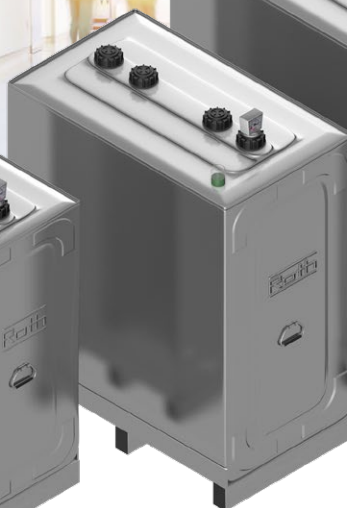
Duo System 1000 T