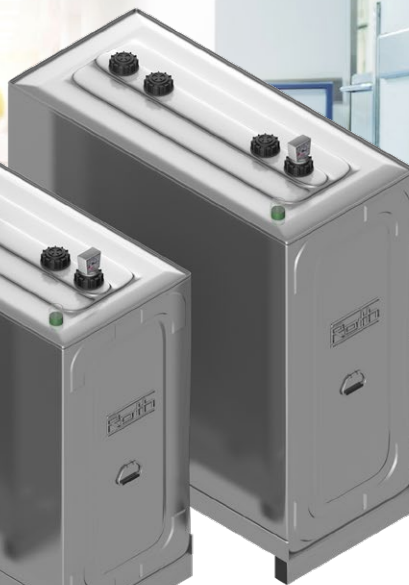
Duo System 1500