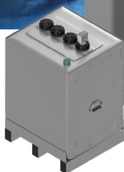
Duo System 400

Depósitos con marcado CE bajo la norma europea EN 13341, de acuerdo al reglamento de productos de la construcción 305/2011.