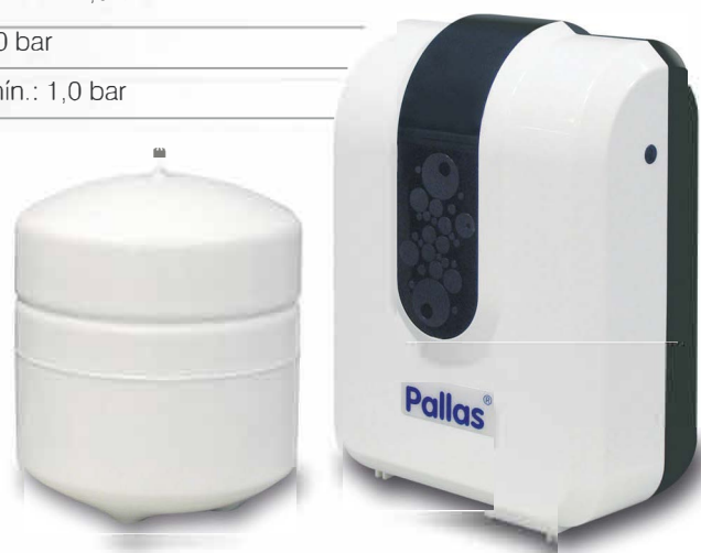
ENJOY SLIM con acumulador

El agua de entrada de los equipos debe ser bacteriológicamente potable.