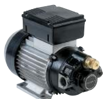
BOMBA DE CA - VISCOMAT VANE