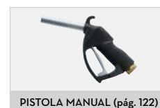
PISTOLA MANUAL (pág. 122)