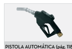
PISTOLA AUTOMÁTICA (pág. 118)