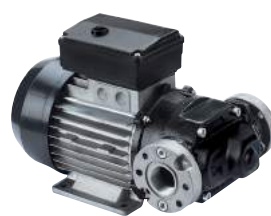
BOMBA DE CA - E120