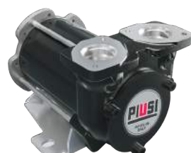
BOMBA DE CC - BP3000