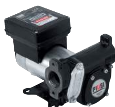
BOMBA DE CC - PANTHER DC