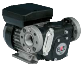
BOMBA DE CA - PANTHER