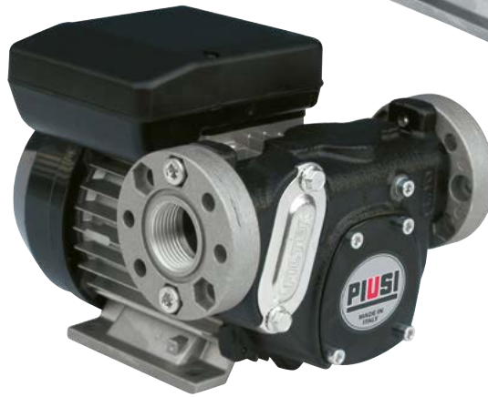
PANTHER 72 - PANTHER 90 (con embridado)