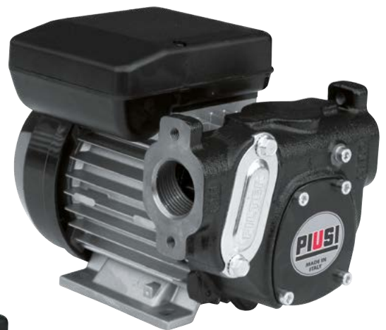
PANTHER 56 (sin embridado)