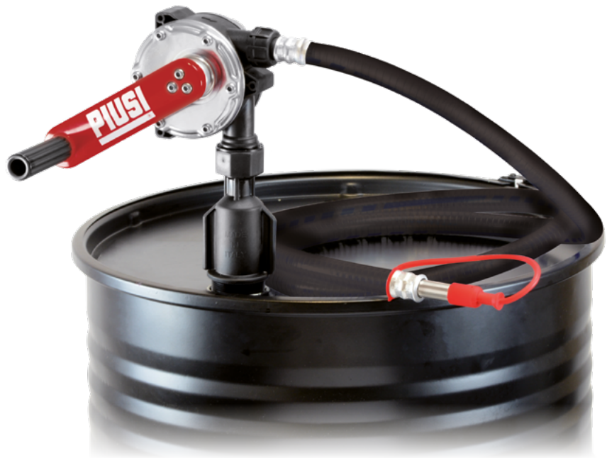
PIUSI HAND PUMP CON MANGUERA Y BOQUILLA DE ACERO INOXIDABLE