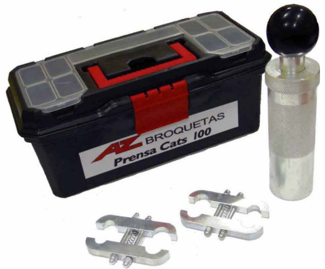
Prensa manual Cats 100