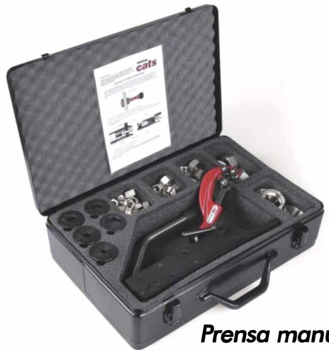
Prensa manual Cats 120