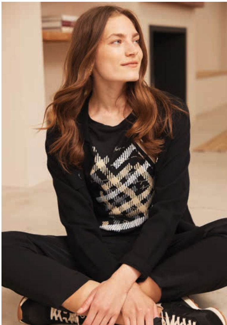
Small details, big differences.