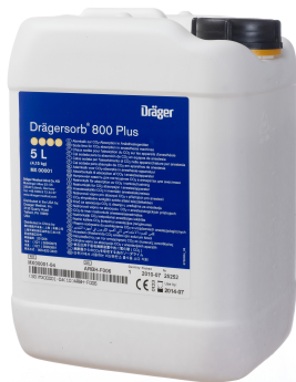
Garrafa de 5 litros para canisters reutilizables