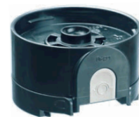
Adaptador para canister desechable