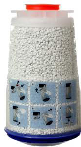
Canister desechable 1,2 L