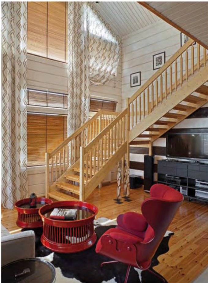
Private house near Kiev, Ukraine.