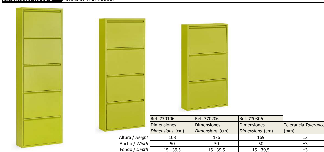
IMAGEN DEL PRODUCTO / PICTURE OF THE PRODUCT